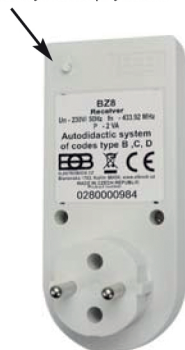
Obr.1,Funkčné tlačidlo (na zadnej strane prijímača)

BZ8-NP je možné použiť s vysielačom NT-BCD a WS113 (montáž pod vypínač).